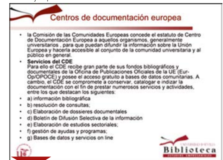
Figura 1: Presentación utilizada como si fuera un documento.

En la Figura 1 vemos un ejemplo de uso de una presentación como si fuera un documento: la diapositiva posee demasiado texto, frases y párrafos enteros, como si fuera un documento de texto. En este ejemplo se han ocultado los elementos que pudieran identificar el origen de la presentación, ya que se trata de un ejemplo real.